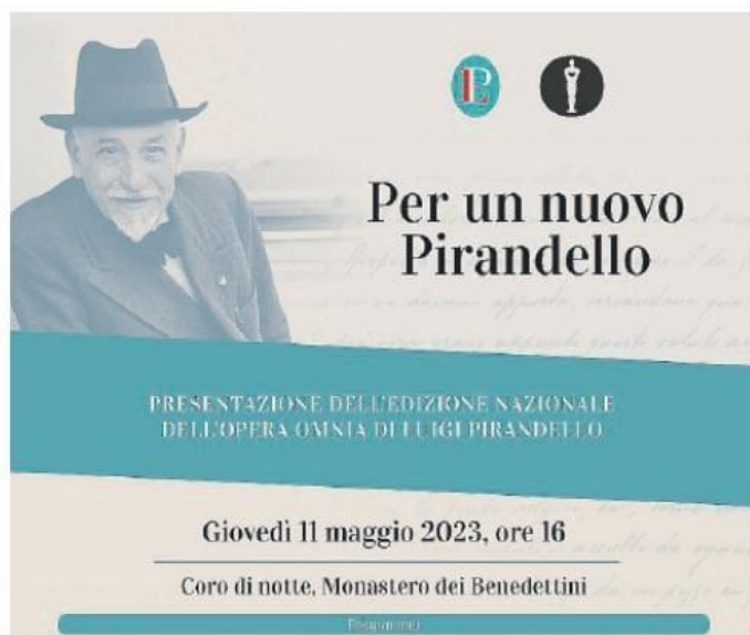
La locandina della presentazione di oggi pomeriggio

Oggi alle 16, nel Coro di notte del Monastero dei Benedettini, sarà presentata l'Edizione nazionale dell'Opera Omnia di Luigi Pirandello, coordinata da una commissione nazionale composta da alcuni dei più importanti studiosi dello scrittore e drammaturgo agrigentino, promossa su iniziativa del ministero della Cultura ed edita da Mondadori.