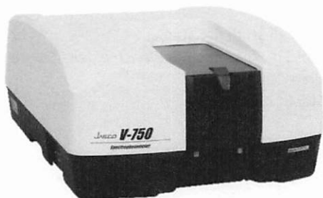
Spettrofotometro Jasco V-750