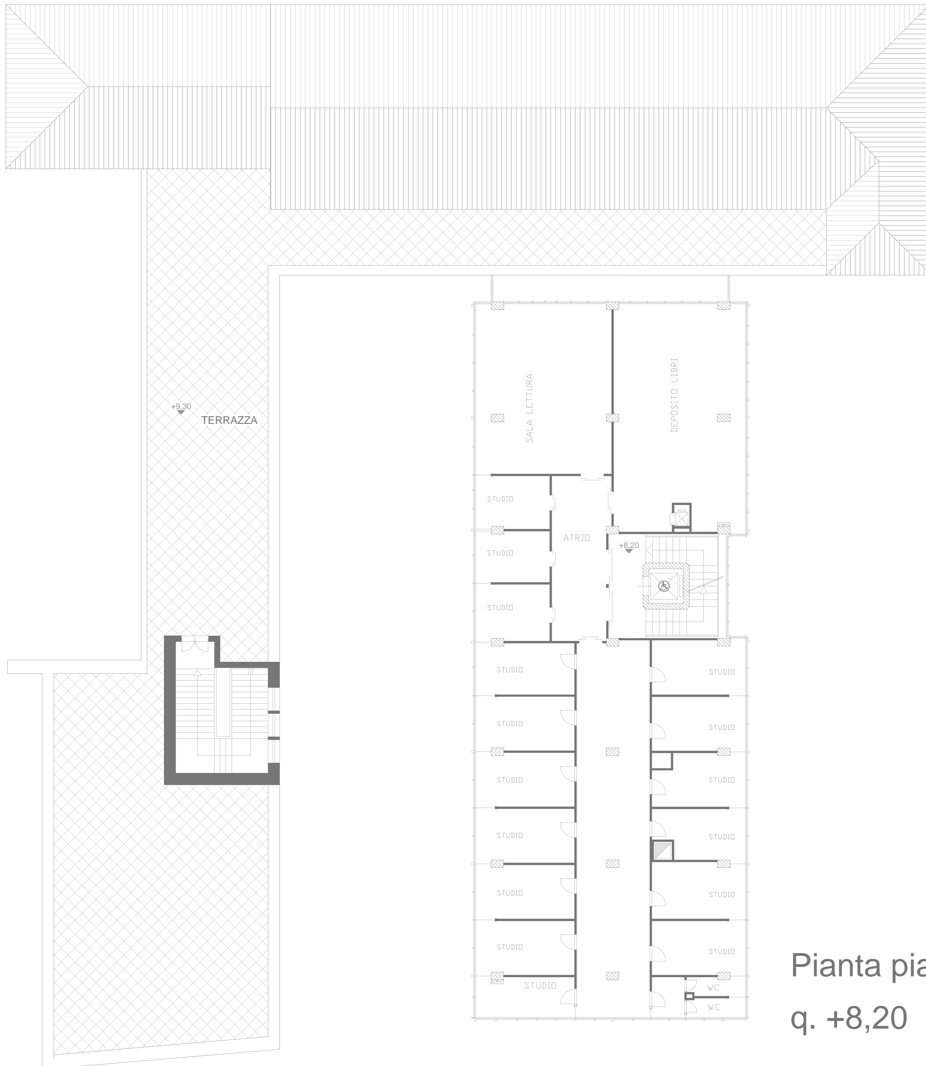
Pianta piano secondo q. +8,20