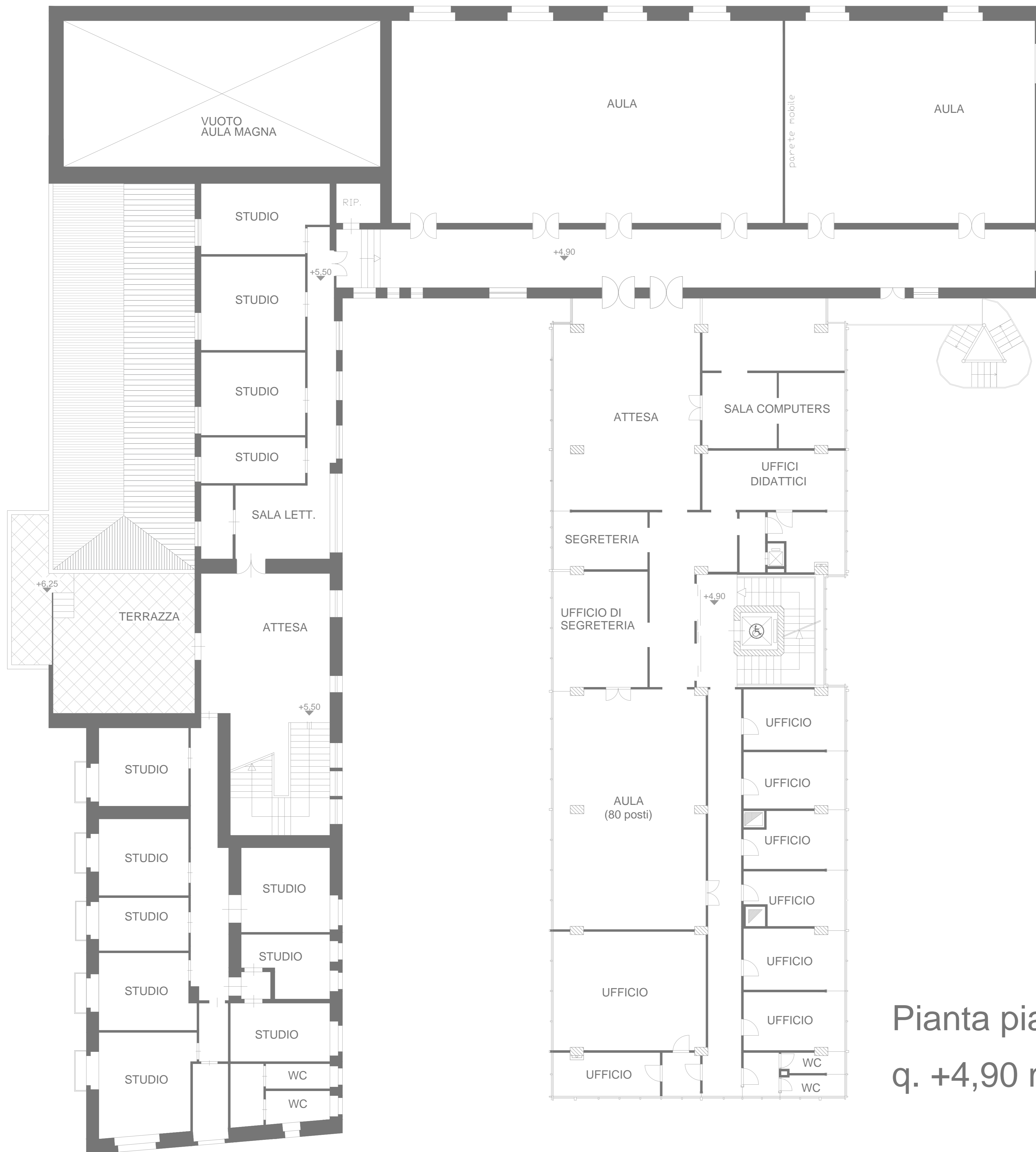
Pianta piano primo q. +4,90 m