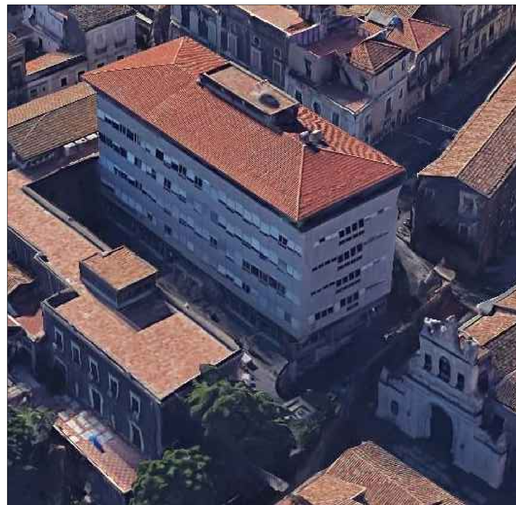
Vista prospettica dell'edificio